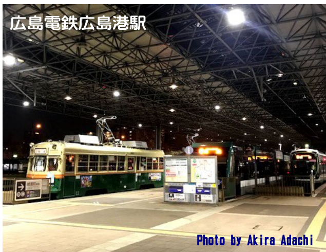
広島電鉄広島港駅