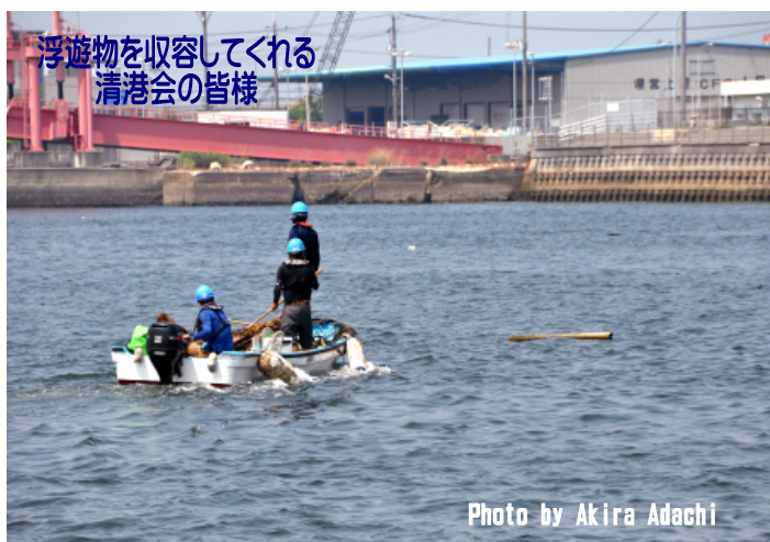
浮遊物を收容してくれる 清港会の皆様