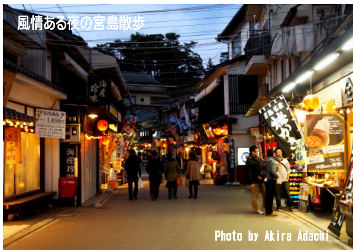
風情ある夜の宮島散歩