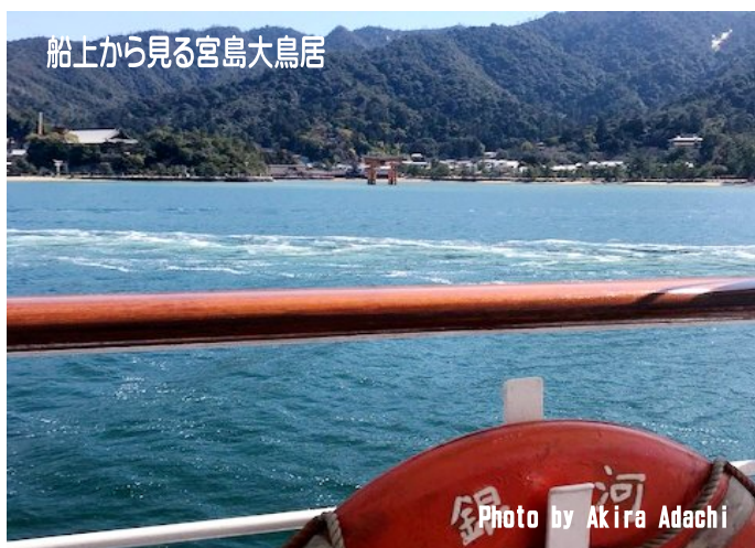
船上から見る宮島大鳥居