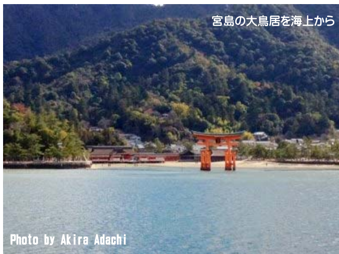
宮島の大鳥居を海上から