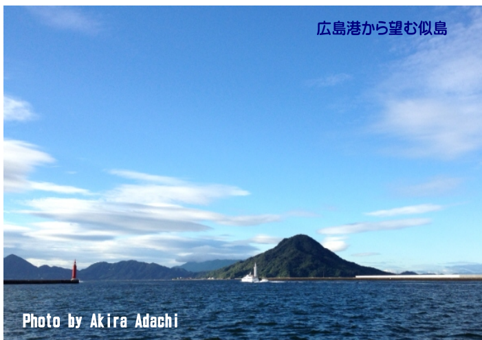
広島港から望む似島