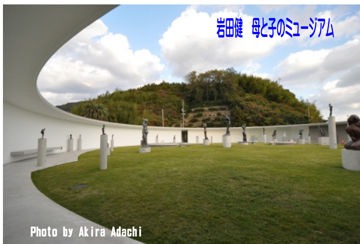
岩田健 母と子のミュージアム