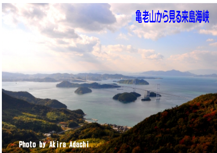
亀老山から見る来島海峡