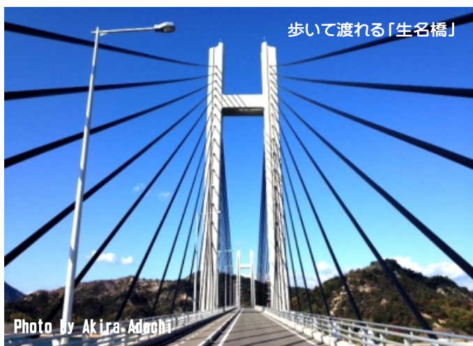
歩いて渡れる「生名橋」