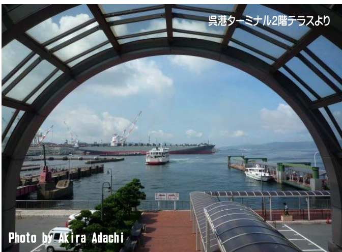
呉港ターミナル2階テラスより