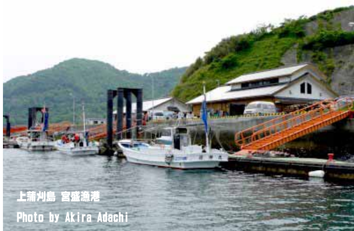
上蒲刈島 宮盛漁港